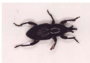
Charançon du bananier

Aux Antilles, l'utilisation d'insecticides et nématicides de la famille des organochlorés a été intense : l'HCH (mélange d'isomères, alpha, bêta, gamma-HCH ou le gamma-HCH seul, appelé également lindane), l'aldrine, la dieldrine et le chlordécone (Képone, Curlone) ont été principalement utilisés contre le charançon du bananier ( Cosmopolites sordidus ).