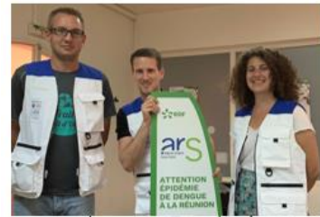
Appui à la lutte anti-vectorielle à la Réunion

A date 5 , plus de 1 000 réservistes sanitaires ont été mobilisés sur ces missions soit 8000 jours/Homme. C'est une mobilisation sans précédent pour la Réserve sanitaire qui avait réalisé, pour exemple, sur toute l'année 2019, 6 709 jours/Homme de mission.