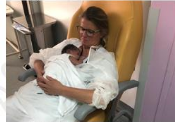
Renfort du service de néonatalogie de Mayotte