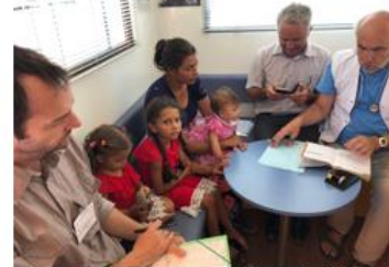
Campagne de vaccination contre la rougeole à Nantes