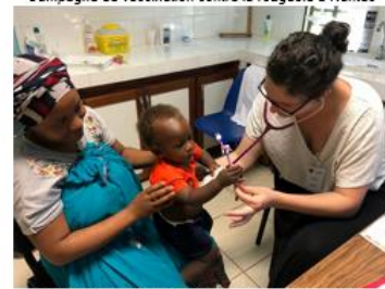
Renfort et soutien des centres de PMI de Mayotte