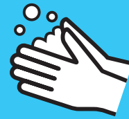
خپل لاسونه پرېمنځئ