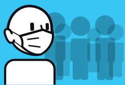
Use uma máscara quando estiver perto muitas pessoas ou se estiver doente