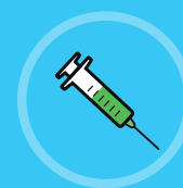
Vacina contra a gripe, a covid e algumas gastroenterites

Para as crianças ou pessoas fragilizadas, se estiverem doentes, deverão consultar um médico . Se não tiver um médico disponível, ligue para o 15