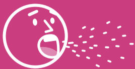
Gotículas de saliva