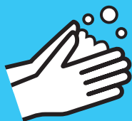
Lave as mãos