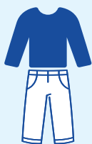
Portez des vêtements amples et couvrants