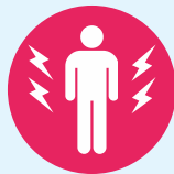
Douleurs musculaires ou/et articulaires