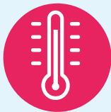
Fièvre d'apparition brutale

En l'absence d'autres signes d'appel infectieux