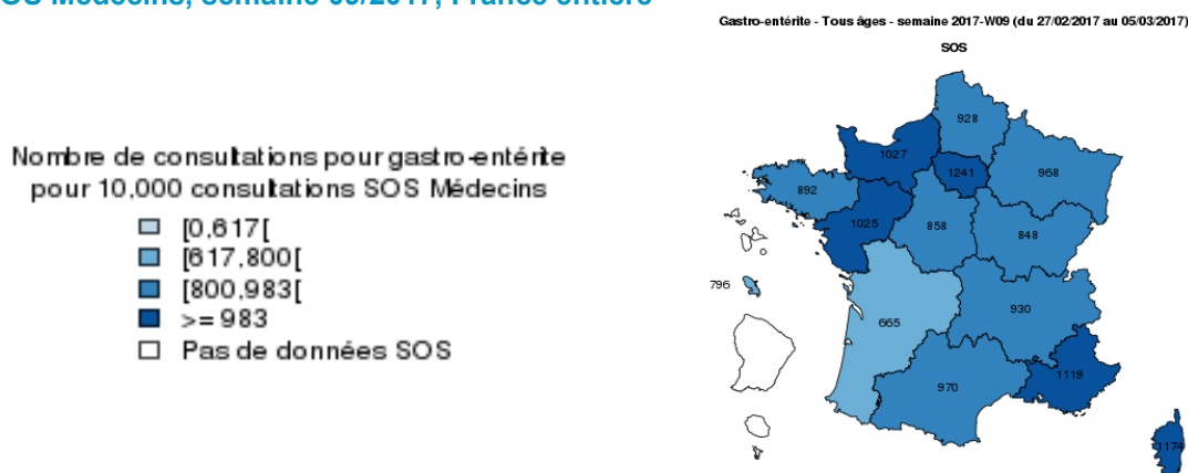
Figure 3- Distribution régionale du nombre de consultations pour GEA pour 10 000 consultations SOS Médecins, semaine 09/2017, France entière

En semaine 09 Pour 60 associations représentant 97% des associations SOS Médecins, la proportion de consultations pour GEA est de 9.8% de l'activité totale. Cette activité est stable par rapport à la semaine 08 et est supérieure à celle observée lors des deux saisons précédentes à la même période. Les activités les plus fortes ont été relevées en Ile de France, PACA et Corse (Figure 3).