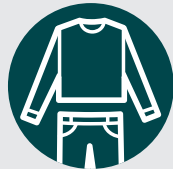
Vêtements amples et couvrants