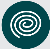
Serpentins à l'extérieur